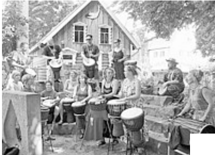
Mit afrikanischen Liedern unterhielten die Trommler der Gruppe Epba die Besucher im Eine-Welt-Dorf.

Minden (rkm). Der Verein "100 Prozent für Afrika" veranstaltete zusammen mit der Friedenswoche Minden im Eine-Welt-Dorf einen Afrika-Tag unter dem Motto: "Projekte für nachhaltige Bildung - Wie lässt sich Bildung und Nachhaltigkeit in unterschiedlichen Kulturen vereinbaren?"