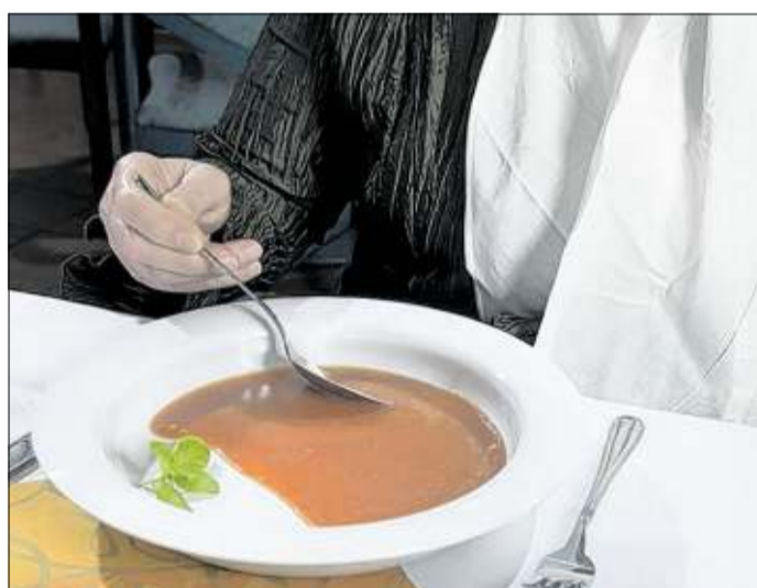
Der Teller „Vital“ hat bereits mehrere Design-Preise erhalten. Der Unternehmensbereich ProVita gewinnt für Ornamin an Bedeutung.

„Besonders die Ergebnisse im ersten Halbjahr blieben weit hinter den Erwartungen zurück. Das zweite Halbjahr gestaltet sich jedoch trotz Krise