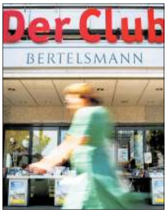
Mit dem Zugpferd Bertelsmann ist Gütersloh der stärkste Kreis in OWL.

Der Autor der Studie, Henner Lüttich, spricht von einer „Spreizung der Zukunftsaussichten“ und meint damit das zunehmende Gefälle zwischen strukturschwachen und wirtschaftlich starken Regionen in Deutschland. Entscheidende Untersuchungsmerkmale bei der Studie waren die demografische Entwicklung, Dynamik des Arbeitsmarkts, gewerbliche Investitionen, Wertschöpfung der Erwerbstätigen und das Einkommen privater Haushalte.